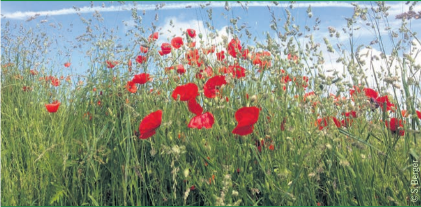
GOTTESDIENSTE IM JUNI