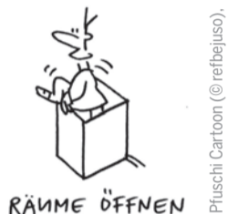
Pluschi Cartoon (© reibejus).